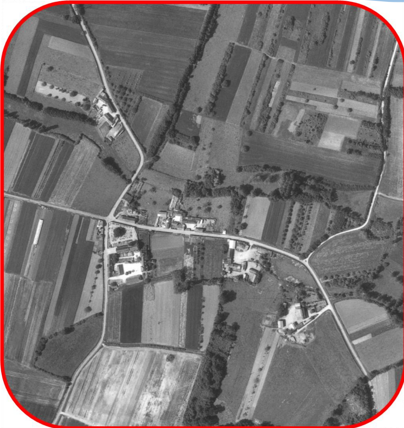
Le bourg de Cizay la Madeleine en 1967