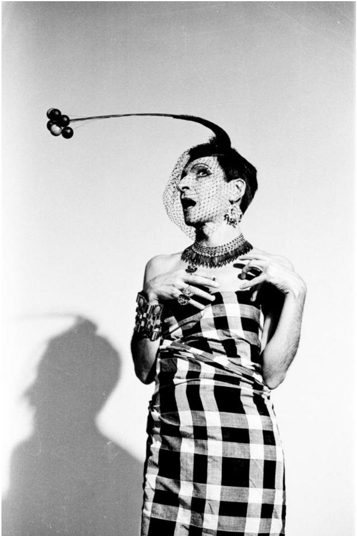
Un des personnages de la pièce «le Frigo», crée en 1983, que Copi jouait en solo.